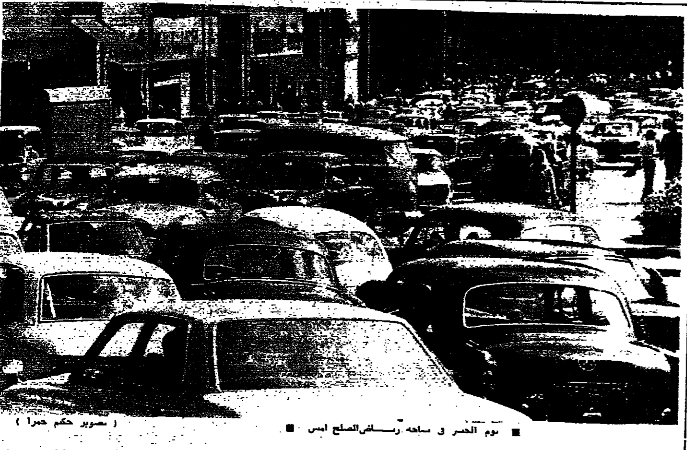
يوم الحشر في ساحه راس الصالح امس

كثفت الحركة في العاصمة وضواحيها نشطة قبل ظهر امس ، ولكن وتوسع انفجار في الساعات القليلة بعد الظهر ادى الى اغلاق المحلات وحروب المارة بسرعة كبيرة . تفتحت المحلات والمؤسسات والشركات التجارية بنسبة ٥٠ بالمائة صباح امس ، وازدهمت تسوارع اللبني ، والمعرض ، والمصارف ، وورش الصلح والبرج - والمزبعا ، والدياس ، وديار اديس ، وشركة الخوري ، والحمراء ومطعماتهما ، وبالسيارات والمارة . وكثرت نسبة اقبال المواطنين على التفتحة الخضراء تقسم كما يلي : ٨٠ - بالمائة نزولوا الى التسوارع الرئيسية للتحرق على اثار المصارف والخراب الذي خلفته الاحداث الاخيرة . ٢٠ - بالمائة توجهوا الى المصارف لسحب مبالغ نقدية على سبيل الاحتياط بعد نفاذها لديهم ، وتفرقا من حدوث اشتبهات جديدة مفاجئة . اما الذين اتفموا على شراء بعض الحاجيات من الاسواق ، فان مشورتهم انصرت على المواد الغذائية والتوابيع ، وبالنسبة لحسابات التوابيع ، والادوية والكهليات ، ويصعب تسال زال اصحابها مترددين في زوال اعمالهم المتضررين . ٢ - لاحظ مجلس الادارة وممثلو الاسواق ان هناك بعض المؤسسات لم تفتح ابوابها اليوم ( امس ) ، وما زال اصحابها مترددين في زوال اعمالهم المتضررين . ٣ - وبعد ان تفتحت الهيئات الاقتصادية في الاجتماع الذي تطلعت فيه الجمعية بمندوبين عنها ، والتطهيرات